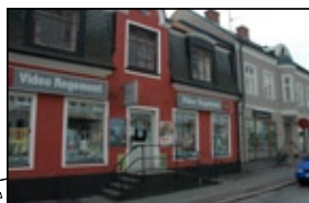
Bergman Norra 3 A.