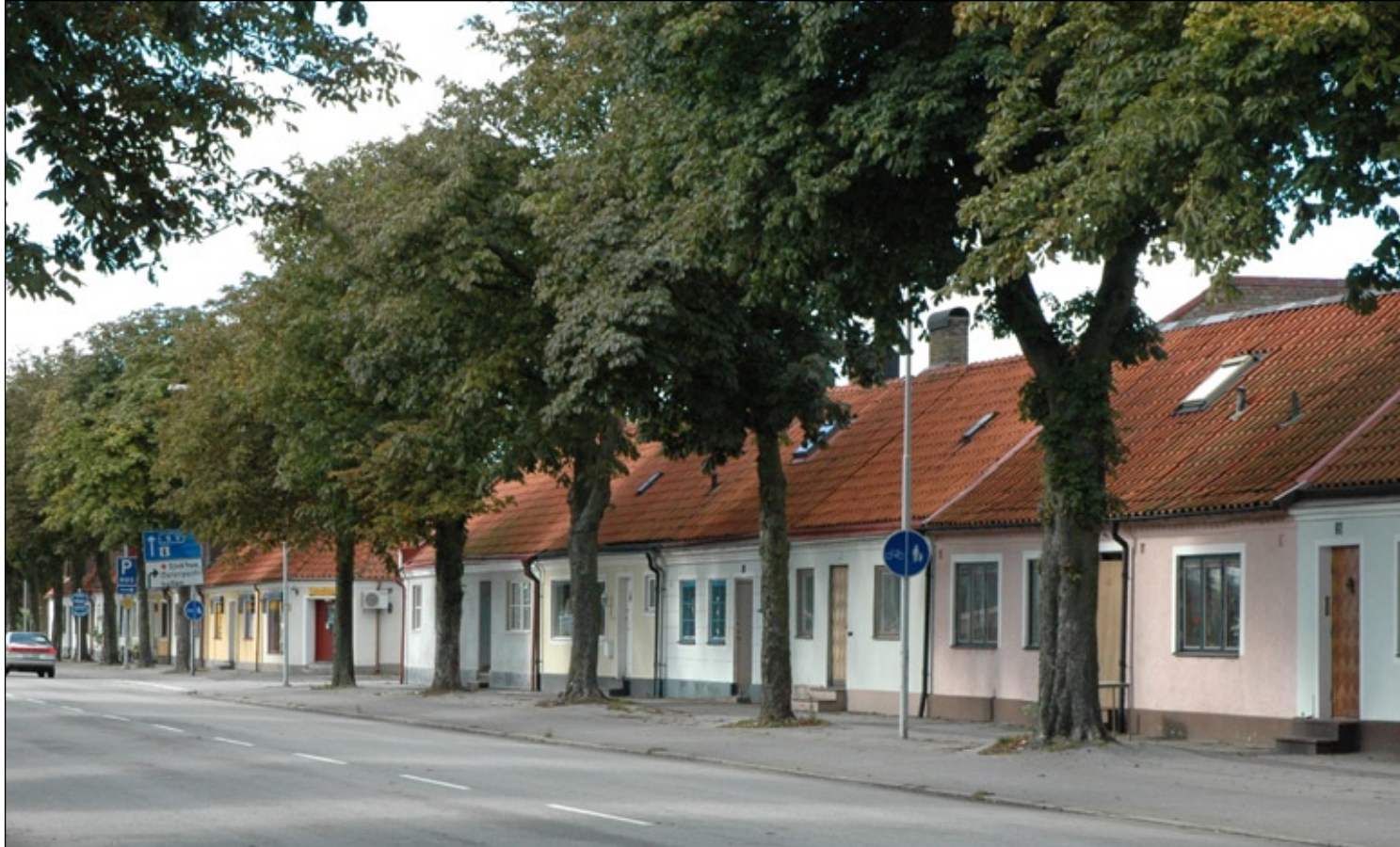
Östra Förstaden ut mot Österleden.