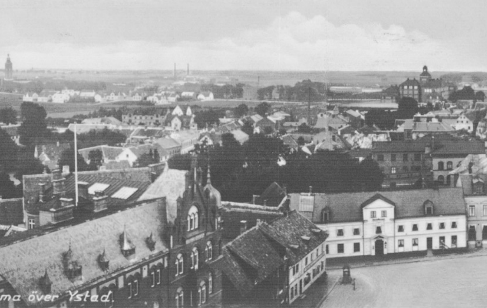
Vy över staden österut, 1915.