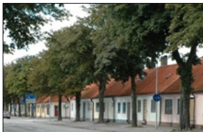
2. Östra Förstaden.