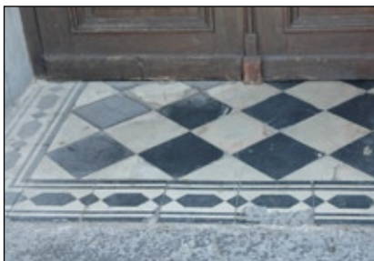
Viktoriaplattor i entré.