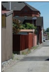
Plank och garage är vanliga på bakgatorna.

Gator och parker är en viktig del för helheten i stadsmiljön och måste därför ägnas lika stor uppmärksamhet som byggnaderna.