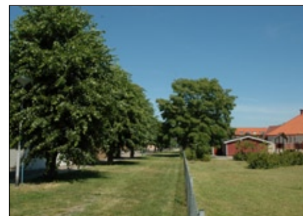
Grönstråk – Sylvans park.