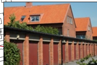
Fridhem 1 B och D.