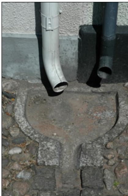
Omsorgsfullt utförd detalj i trottoar.