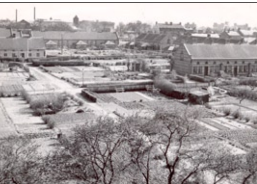
Det gamla Fridhem.