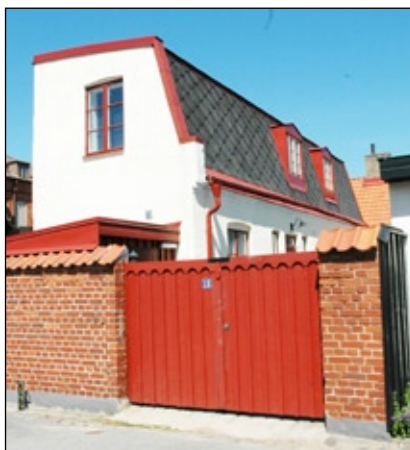
Gårdshus vid Lilla Hejdegatan.