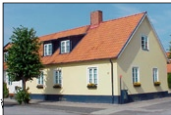
Cronholm Södra 5A.