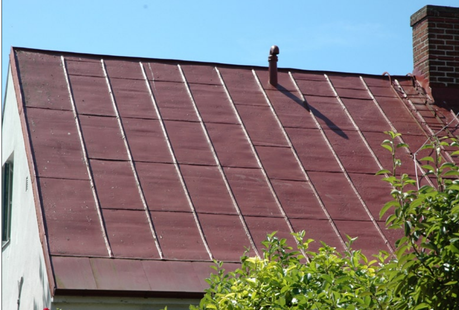
Tak med traditionellt lagd skivplåt.