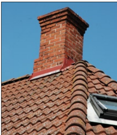
Skorsten med bas och krona.