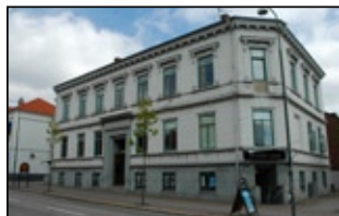
Areskough Södra 1 A.