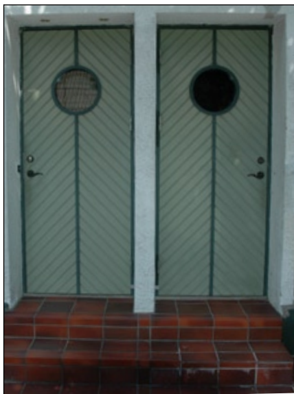
Moderna dörrar i äldre parhus.

▼ I vissa fall kan det vara svårt att avgöra byggnadens ålder eftersom fasadernas material ändrats och fönster- och dörrpartier bytts ut. Även