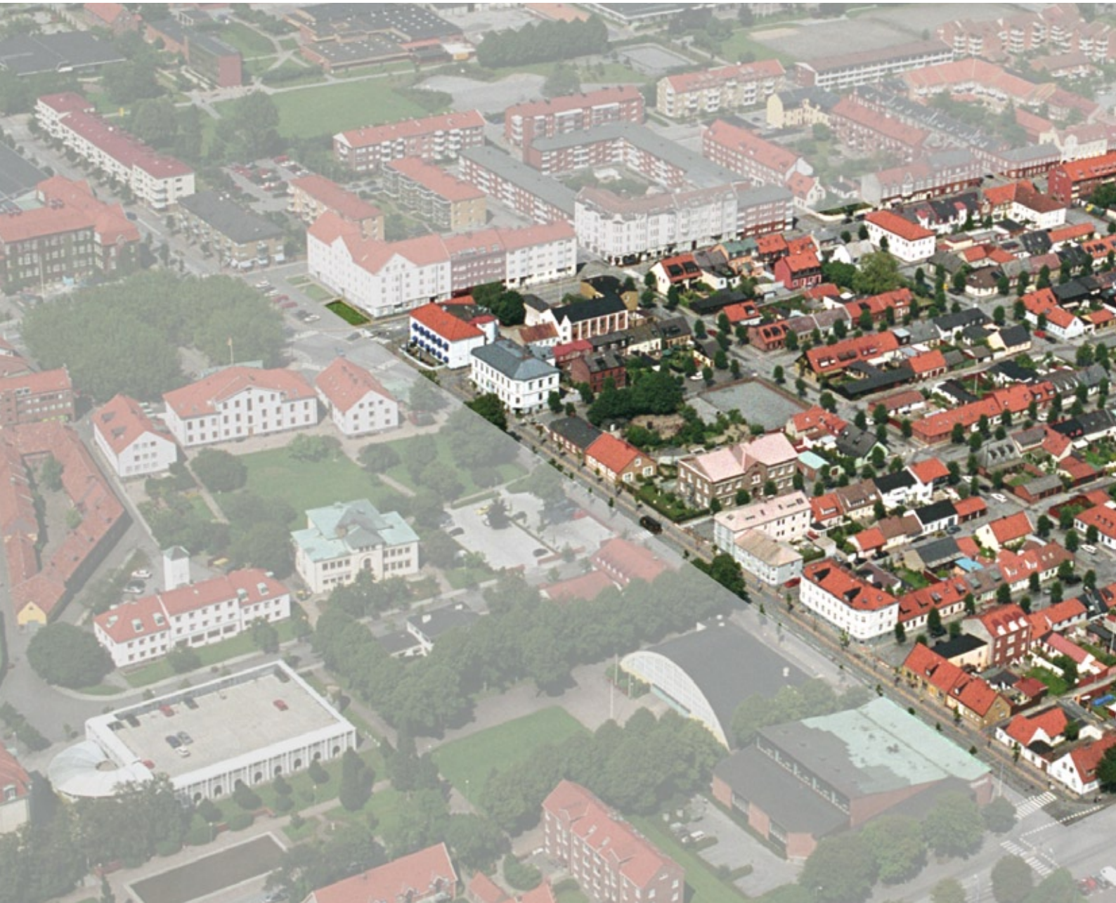
Östra Förstadens rutnätsplan och blandade bebyggelse lite från ovan.