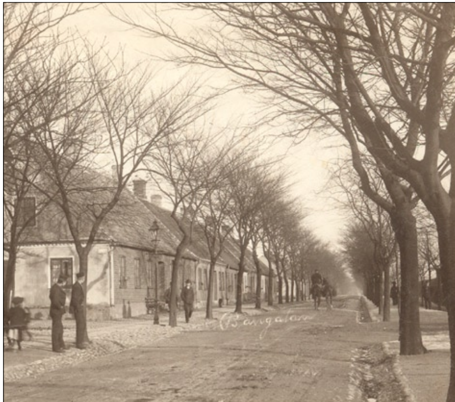
Österleden med Jennygatan till vänster, omkring 1900.

Jennygatan 3. Båda byggnaderna är uppförda i en typisk klassicistisk arkitektur från 1800-talets senare del.