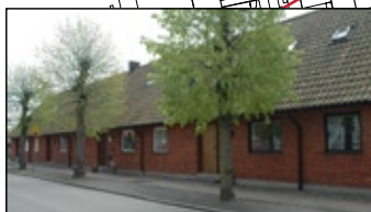
Nils Norra 7A - 10A.