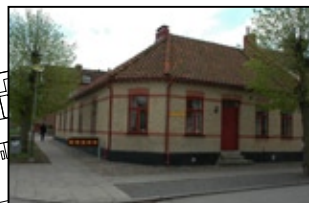
Haak Norra 6.