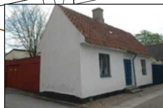
Uppendick Södra 1 B.