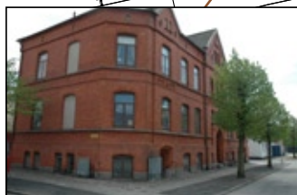
Uppendick Norra 1 A.