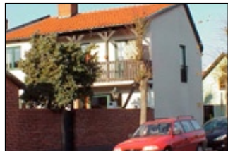
Lundgren Norra 5A.