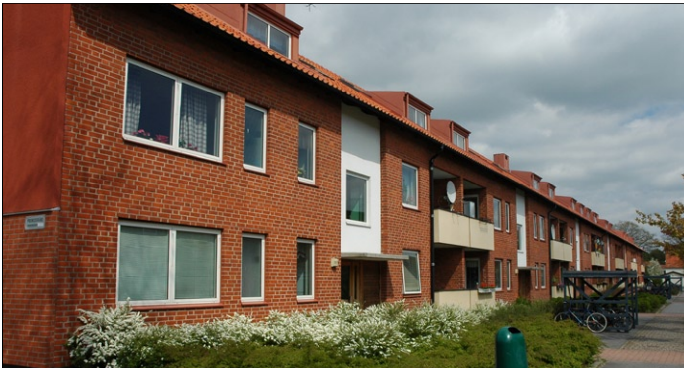
Fridhem med sin tidstypiska 1960-talsarkitektur.

Det har också blivit allt vanligare att fasader, som är utsatta för väder och vind, tilläggsisolerats. Det har ofta gjorts med en inre skiva av isolerande material på vilket putsbruk sedan sprutats. Byggnadens karaktär har ofta förändrats till det sämre och på sikt kan även dess tekniska uppbyggnad och hållbarhet ifrågasättas.